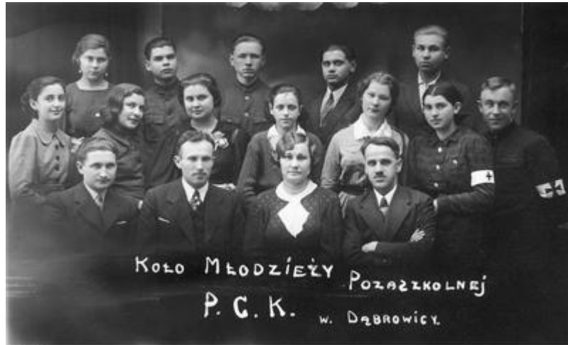
Koło Młodzieży Pozaszkolnej PCK w Dąbrowicy, 1937 r.

Koła Młodzieży PCK zakładane były we wszystkich typach szkół: szkołach średnich, gimnazjach, szkołach zawodowych, handlowych, seminariach nauczycielskich i szkołach powszechnych, a z czasem powstały także koła akademickie.