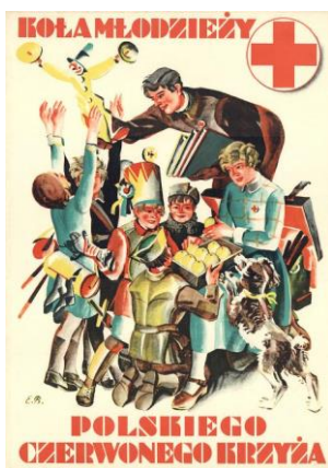
Plakat Koła Młodzieżowego PCK, lata 20-te XX wieku

„... pragniemy obudzić w sercach naszych dzieci i młodzieży ducha miłości bliźniego i poczucie obowiązków względem wszystkich ludzi, czynienia dobra, gdzie tylko siły pozwalają, nie tylko dla innych celów, ale dla samego dobrego czynu, do szukania nagrody za czyny dobre we własnym przeświadczeniu o spełnieniu obowiązku. Pragniemy przez czyny miłosierdzia przeciwstawić samolubstwu miłość ogółu, którego dobro jest zarazem dobrem każdej jednostki. Jakkolwiek sformułujemy ten cel, drogi do niego prowadzą przez zrzeczenie dzieci i młodzieży pod sztandarem Czerwonego Krzyża i przez ich czynny udział w działalności...” – w ten sposób cel działania młodzieży określiła Komisja Główna Kół Młodzieży Polskiego Czerwonego Krzyża.