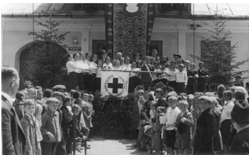
Koło Młodzieży PCK w Muszynie, 1939 r.