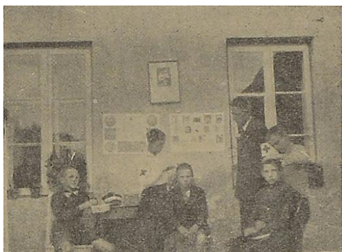
Fryzjerna Koła Mł. P.C.K. w Wilnie.